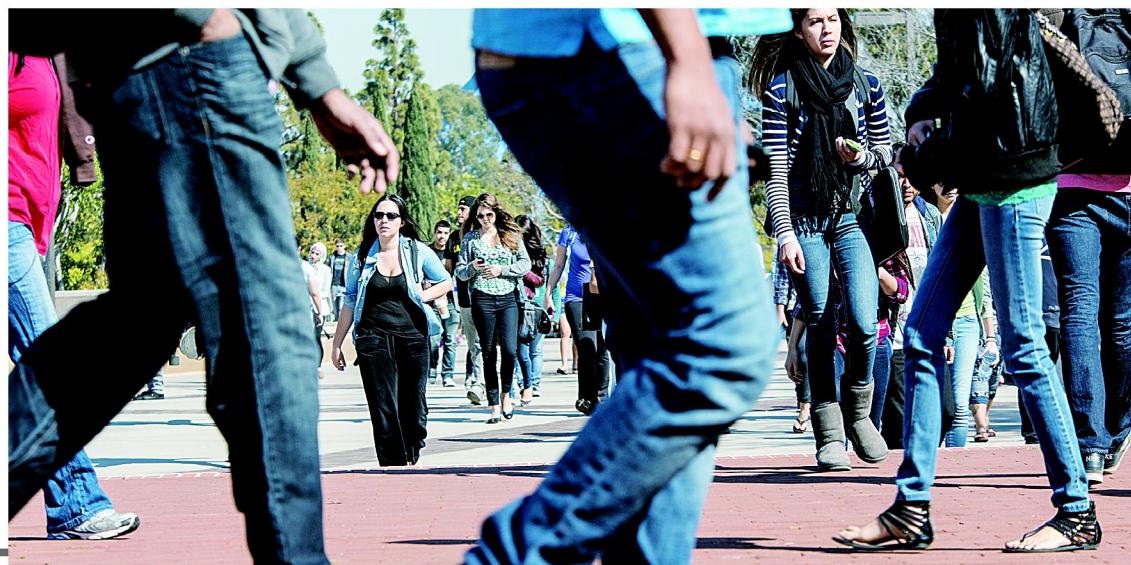
2013년 가을학기 대부분 명문 사립대 신입생 합격률은 역대 최저치를 기록한 것으로 나타났다. (뉴욕타임스)

2013년 가을학기 명문 사립대 입학경쟁은 상상을 초월할 정도로 치열했다. 정상급 스펙을 갖춘 학생들이 줄줄이 탈락의 고배를 마셨을 정도로 대학들의 입학 문이 더욱 좁아졌음을 실감케 했다. 명문대들의 합격률이 사상 최저를 기록했다는 발표가 줄줄이 나오고 있는 시점에 치열한 경쟁을 뚫고 최고 수준의 대학에 합격한 학생들은 후배들에게 좋은 롤 모델이 된다. 뛰어난 학업성과 시험점수에만 그치지 않고 매력 포인트인 '플러스알파'까지 겸비한 한인 명문대 합격생들의 노하우를 소개한다.